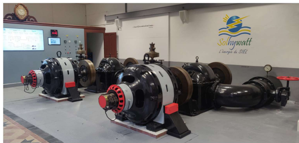
Turbines Francis sous 25 m de chute - Centrale du Fourpéret (25).